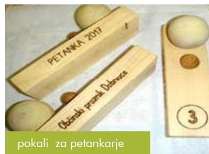
pokali za petankarje