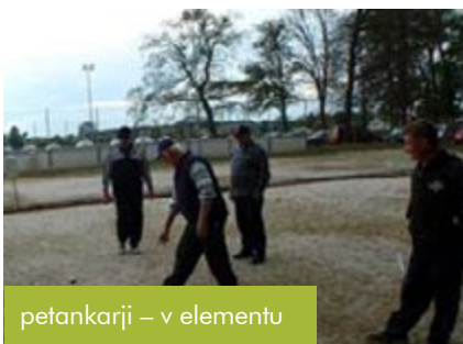
petankarji – v elementu