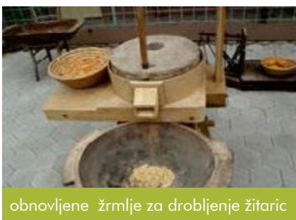
obnovljene žrmlje za drobljenje žitaric