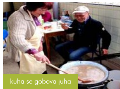
kuha se gobova juha