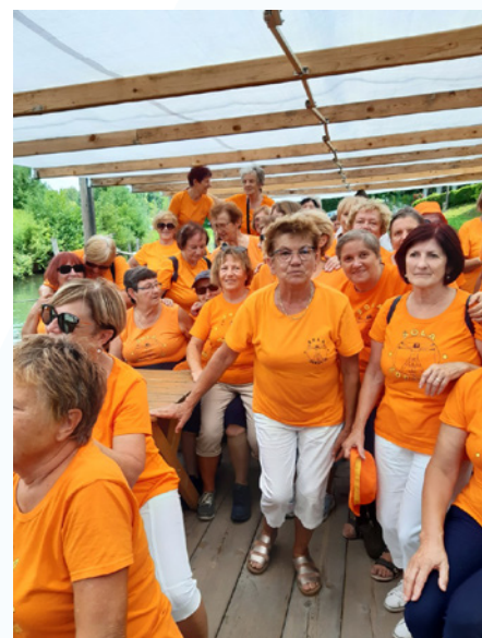
Aktivno druženje članic skupine Avio Skoke na praznovanju na splavu.

Nataša Sinovec, vodja skupine Magnolije Miklavž