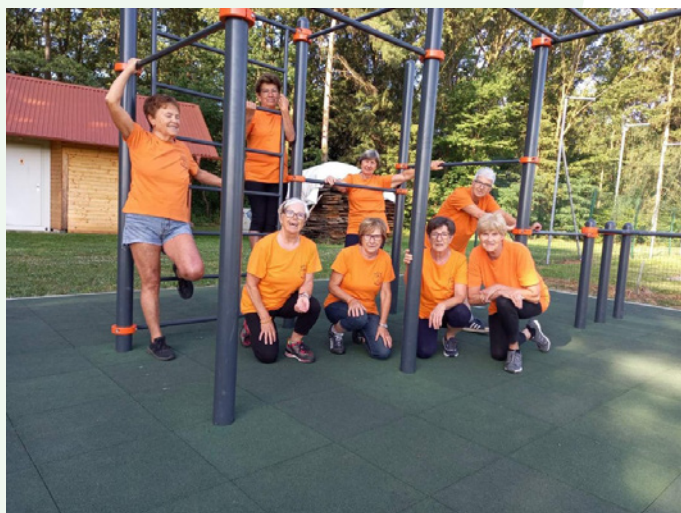
V skupini Avio Skoke svojo jutranjo vadbo rade popestrijo z vsemi razpoložljivimi sredstvi.