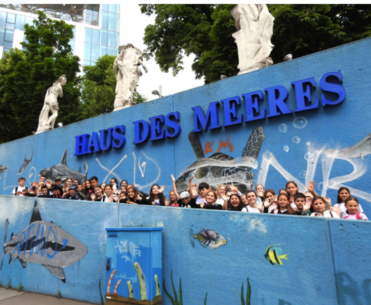
Učenci pred ogledom Hiše morja, ki se vidi v ozadju.