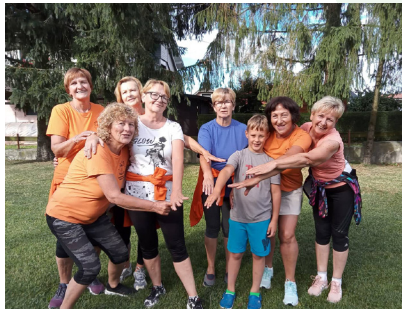
Jutranja vadba 1000 gibov spravi v dobro voljo vse generacije.

Poleg rednega gibanja je eno od pomembnih poslanstev v društvu Šola zdravja tudi spodbujanje k druženju. Tako, kot je gibanje koristno za telesno zdravje, je druženje koristno za mentalno zdravje. Zato se ne izogibamo priložnosti za pogovor, spletnje novih poznanstev in spoznavanje novih ljudi. Ena od takih priložnosti se je ponudila konec junija, ko je skupina društva Šola zdravja iz Razvanja praznovala šest let delovanja. Organizirali so vožnjo s splavom po reki Dravi ob spremljavi avtohtone štajerske jedače in pijače, manjkalo pa ni tudi veselih zvokov iz meha harmonike. Na slavlje