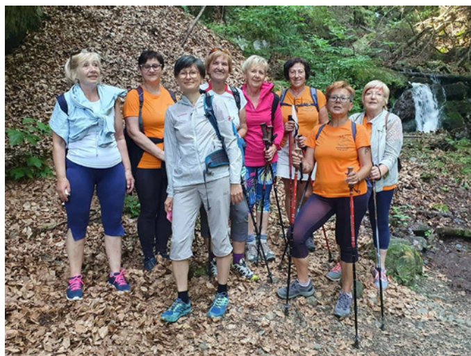
V vročih poletnih dneh prija hoja po senčnih pohodniških poteh. Magnolije Miklavž na poti do Pečk.

Skoke. Poslanstvo druženja v skupini Avio Skoke tudi sicer redno izvajajo, saj vsak petek po vadbi poklepetajo ob kavici.