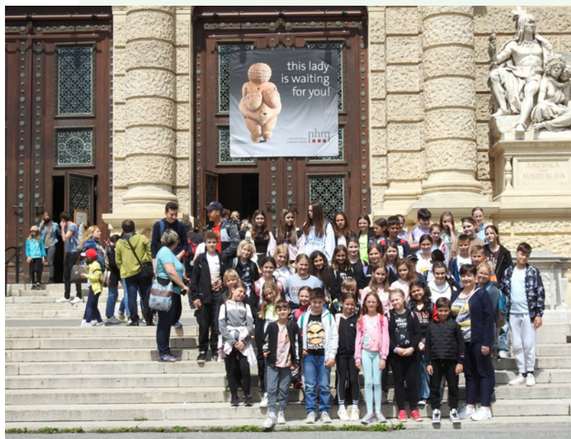
Udeleženci ekskurzije pred Naravoslovnim muzejem